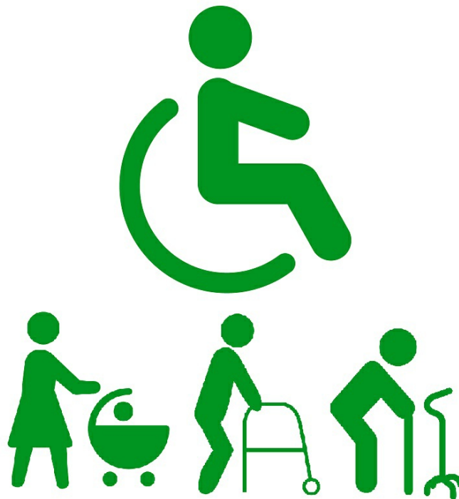
メインサンプル「ウェルチェアビュー・ピクトグラム」

また、車椅子用の自動販売機、エレベータの押しボタン、車椅子乗車のまま入店しテーブルに入れるお店や宿泊施設、観光施設、そしてタクシーや家族や関係者が運転する車などの乗降場などを対象にします。同時にARを使って、競技や観光・グルメなど車椅子でも利用可能な施設やサービスを発信してまいります。