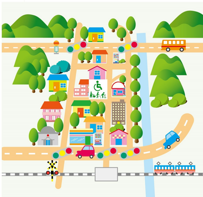
イメージサンプル紙媒体からAR