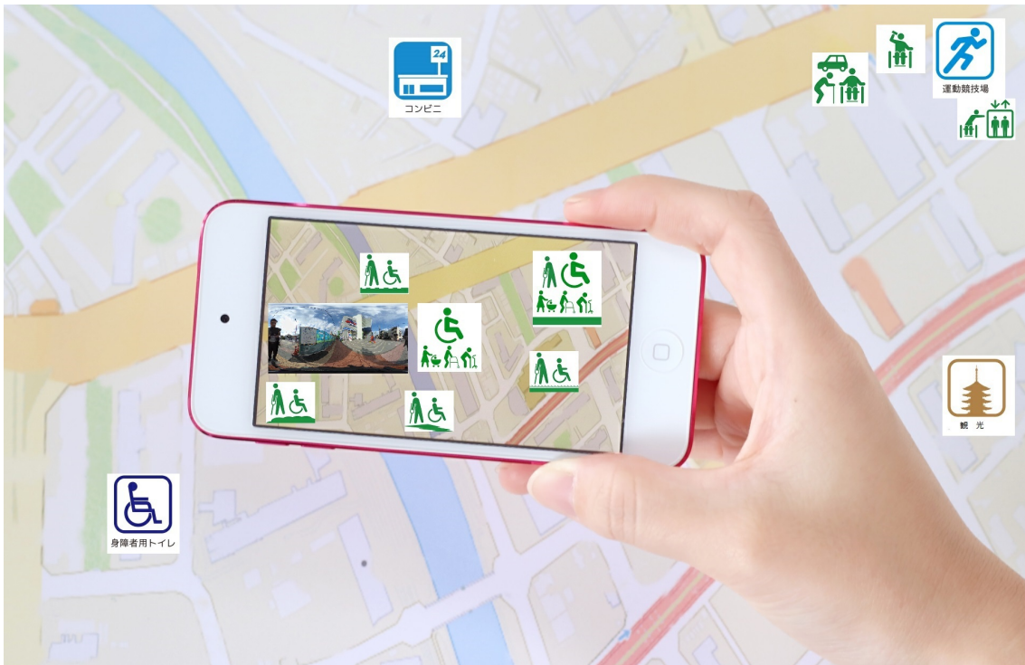
イメージサンプル地図からAR