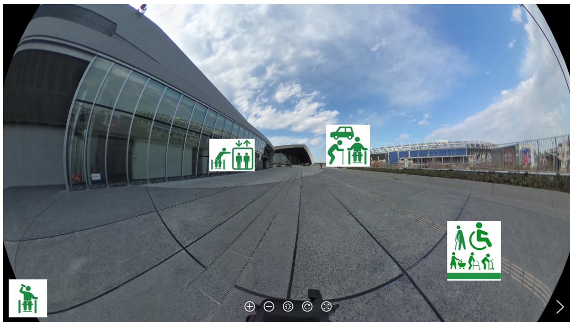
VRフォト車椅子目線経路サンプル。武蔵野の森総合スポーツプラザ