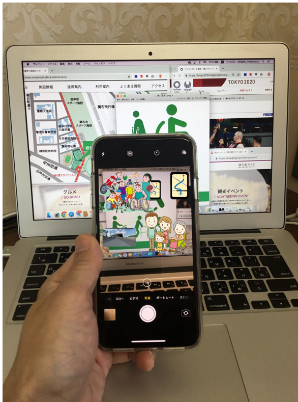
イメージサンプルPC画面からAR